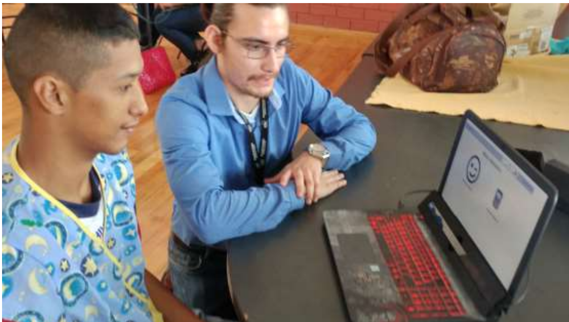
Figura 1. Realización de pruebas del proyecto

Para la navegación por Visual Interactive se utilizó el modelo Tobii Eye Tracker 4C (Tobii AB, 2016) en conjunto con Optikey (véase figura 1).