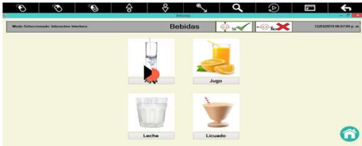
Figura 6. Menú Bebida

Una vez que se acceda a uno de los submenús (Comida, Bebida, Lugares, Baño, Sentimientos, Asistencia, Malestar), el computador confirmará mediante la reproducción de un sonido predefinido y aparecerá una nueva ventana mostrando una nueva serie de elementos a elegir (figura 6).