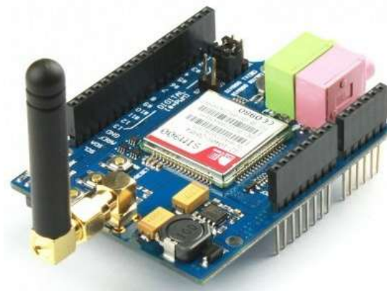
Figura 3. Sim 900 GPRS/GSM