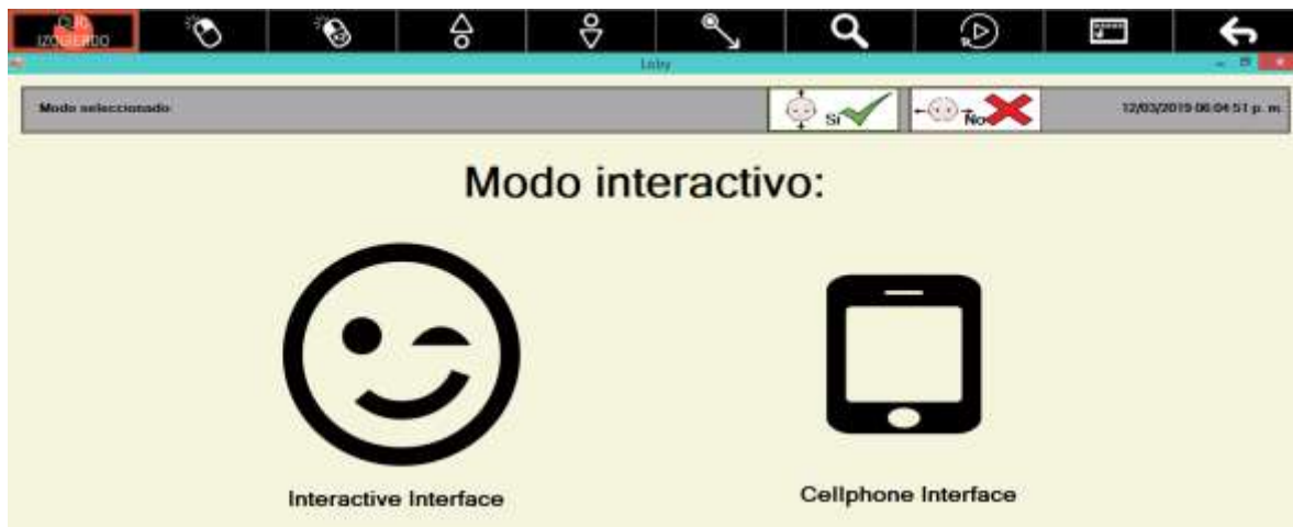
Figura 4. Modos de uso