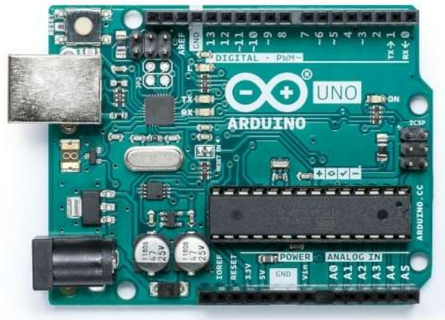
Figura 2. Placa Arduino