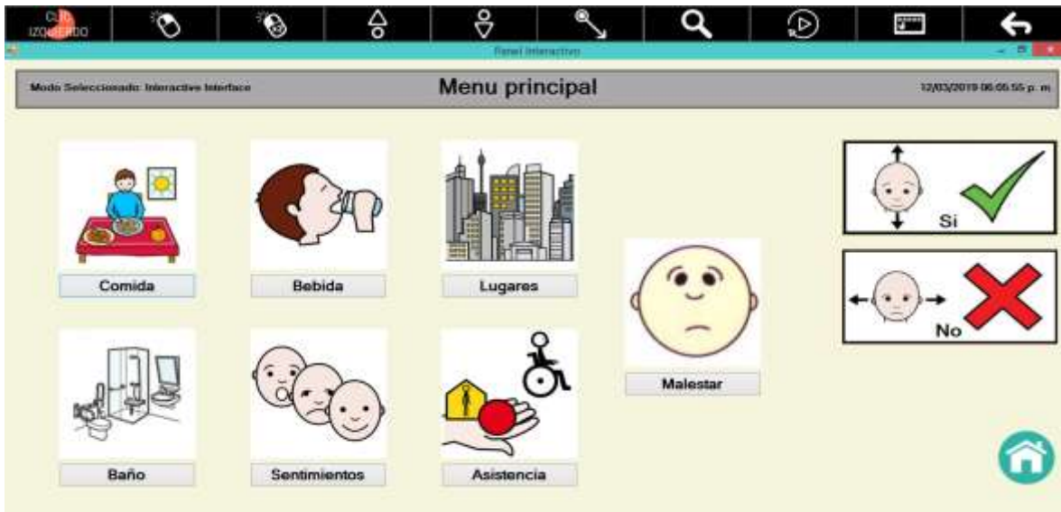
Figura 5. Ventana de menú principal