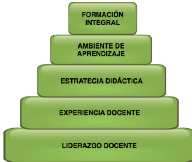
Figura 2. Pirámide para el diseño de estrategias sensoriales

Figura 2. Representación gráfica de la pirámide para el diseño de estrategias sensoriales. La estructura de los peldaños se concibió de forma decreciente por lo que el diseño de la estrategia sensorial inicia con el liderazgo docente y concluye al lograr la formación integral del estudiante.