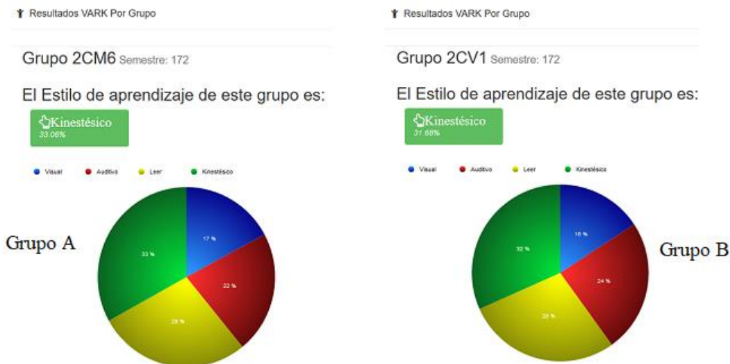
Figura 2. Resultado general del grupo A y B respectivamente.

De acuerdo con el instrumento aplicado para conocer los estilos de aprendizaje, se observó que el grupo A tuvo una preferencia al estilo kinestésico, pero también los estilos de lecto/escritura y auditivo tuvieron una alta preferencia, como se puede observar en la figura 2.