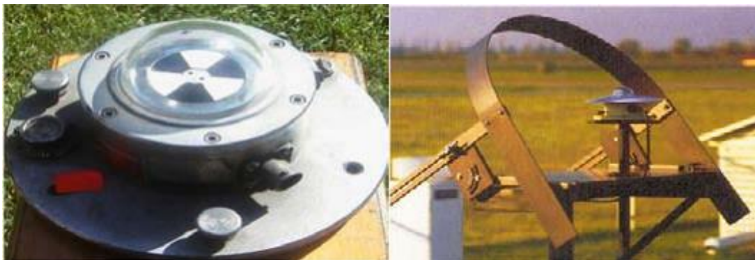
Piranómetro (Lado izq.) y Cúpula de vidrio (lado Der.)

Para evitar el enfriamiento producido por el viento y el efecto de la contaminación atmosférica sobre los sensores, éstos se aíslan mediante una cúpula de vidrio. Para medir la radiación difusa, se instala un sistema que evita la radiación solar directa sobre el sensor (ver fig.4).