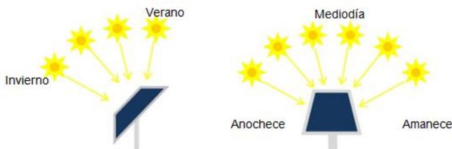
Ilustración del movimiento del sol respecto a un panel fotovoltaico.

Para el caso de la orientación, en el hemisferio norte, debido a que el sol está inclinado la mayor parte del tiempo al sur, la orientación de los paneles fotovoltaicos debe ser al sur. Lo contrario sucede en el hemisferio sur