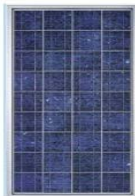
Módulo de celdas solares de Silicio Multicristalino.