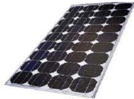
Módulo de celdas solares de Silicio Monocristalino.