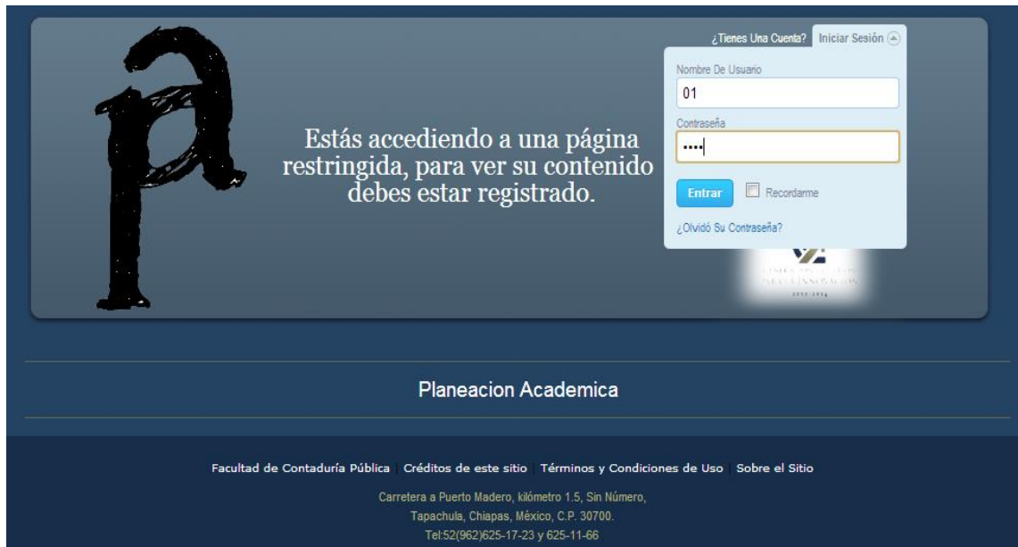
Figura 2: Pantalla de Inicio de Sesión

Una vez introducidos datos correctos muestra la imagen anterior.