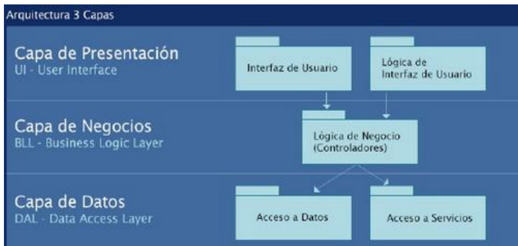
Figura 6. Arquitectura de tres niveles

La capa de Presentación: Es la que presenta la interfaz gráfica se caracteriza por ser amigable por el usuario esta capa se comunica únicamente con la de negocio.