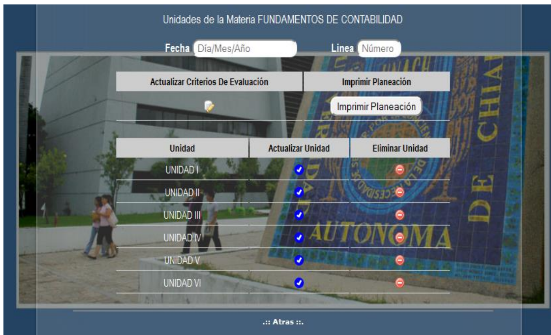
Figura 5.-: Imprimir planeación

Primero nos aparece la leyenda “Unidades de la Materia” seguidamente el nombre de la materia que se haya elegido anteriormente; a continuación pide una fecha, aquí se indica con qué fecha quiere que se expida el reporte en formato electrónico al término. Para rellenar este campo, solo se da clic en él y se despliega un calendario del que solo hay que elegir la fecha.