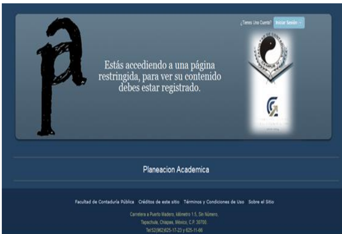
Figura 1. Pantalla Inicial

Para el diseño de la interfaz gráfica de usuario se utilizaron las siguientes tecnologías Html, CSS, JQuery; las cuales son ejecutadas en el navegador Web, lo cual permite un mejor rendimiento en la aplicación, en las siguientes Figuras se puede observar la interfaz gráfica del Sistema Web para el control de la Planeación Académica, como se puede ver en la figura 1.