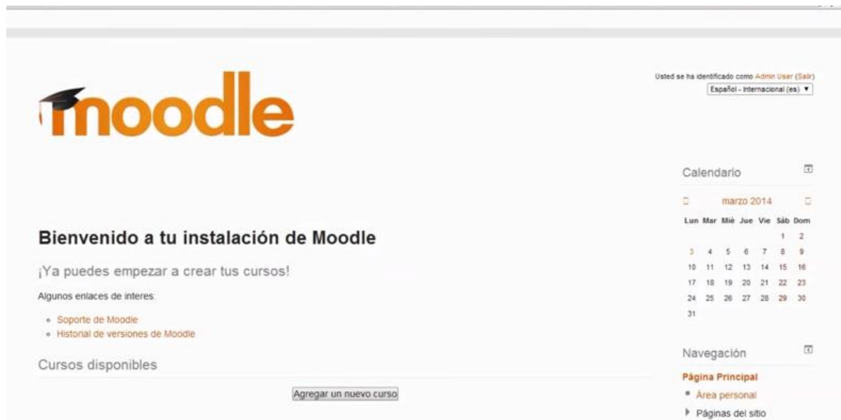
Figura 2. Página principal de plataforma educativa CBTis No. 129

Después de haber realizado las correspondientes configuraciones a la plataforma queda de la siguiente manera (ver figura 3).