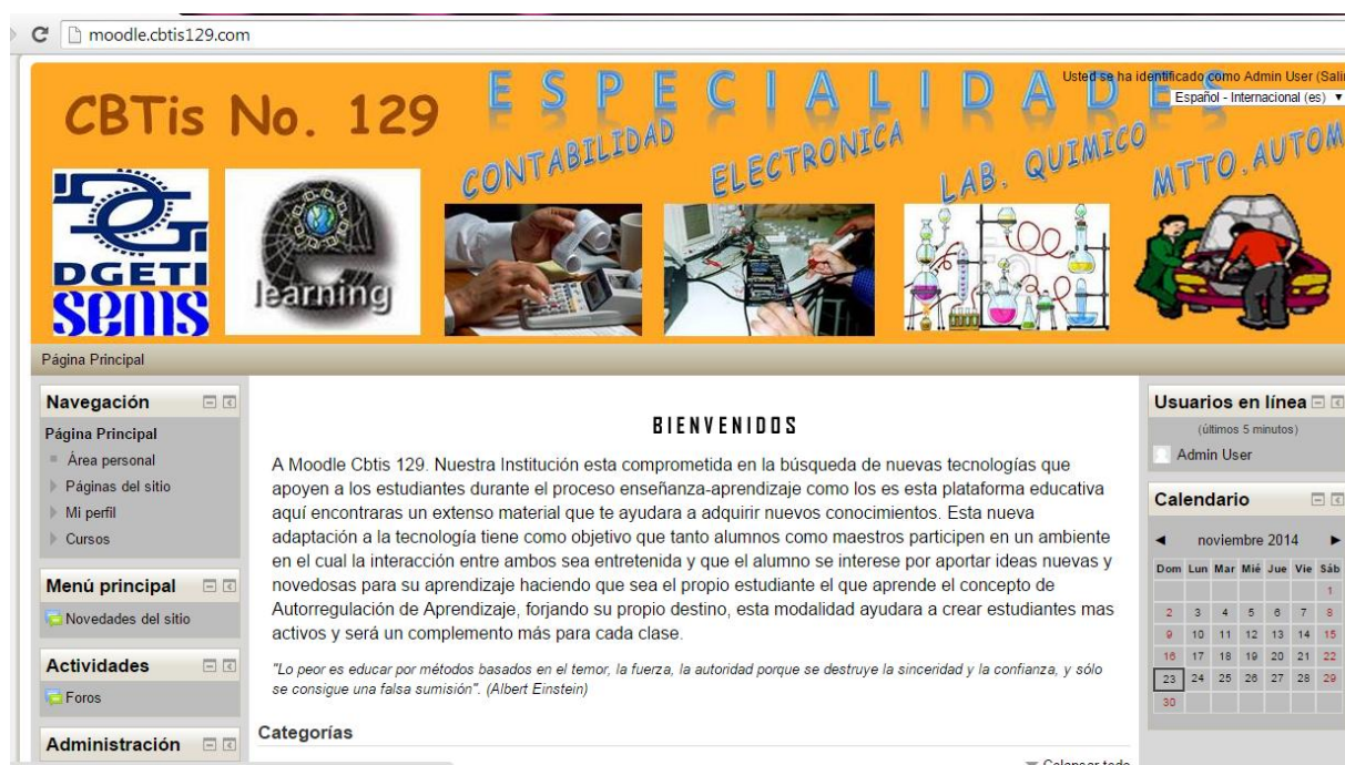
Figura 2. Sitio oficial de plataforma Moodle CBTis No. 129

Después de haber realizado las correspondientes configuraciones a la plataforma queda de la siguiente manera (ver figura 3).